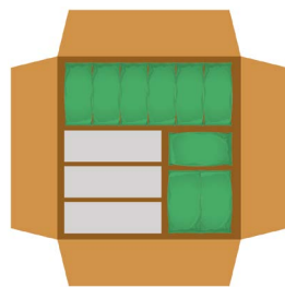
Relleno de espacios vacíos